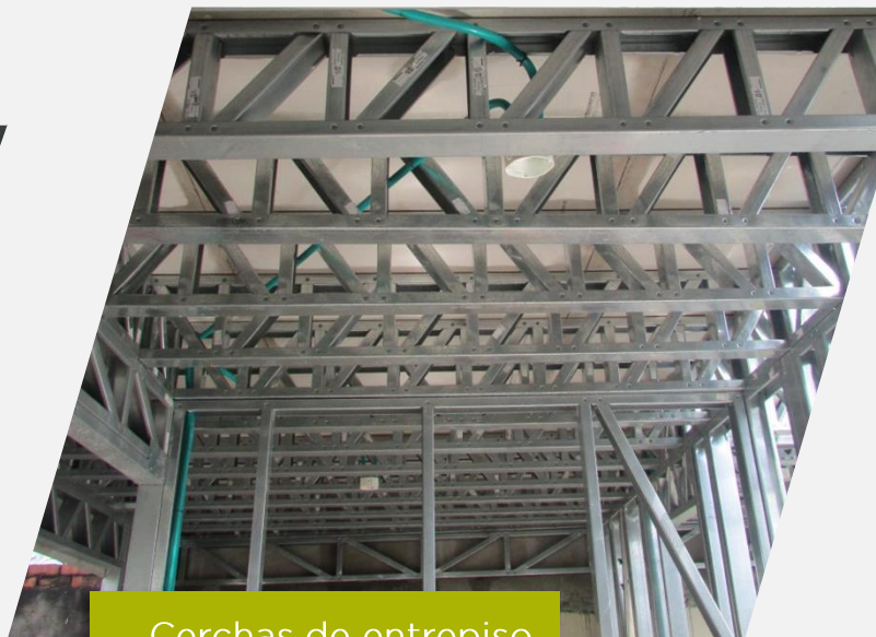
Cerchas de entepiso