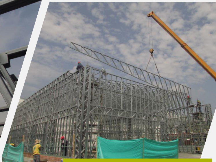
Levantamiento de cercha